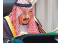
خادم الحرمين الشريفين يتراس جلسة مجلس الوزراء السعودي عبر الفيديو.

ألقت النيابة العامة بتجنس أحد المصابين بفيروس كورونا بسبب تعديه نقل العدوى إلى أطباء مركز الفحص، وذلك في إطار التحقيق مع المصابين بفيروس كورونا.