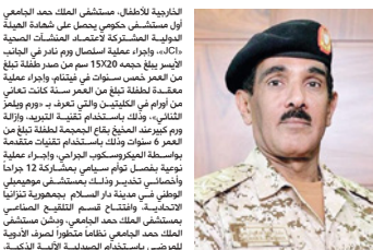
قائد مستشفى حمد الجامعي

المسح أو العدة التي الحيات الطبيعية مع الحد من انتشار الفيروس، ووضع استراتيجيات لتفجع مع المرضين المعنويين والتفجع بجميع الإجراءات الاحترازية لضمان سلامة الموظفين والعرضين الأروم، وتجريب أنظمة التسياس في أماكن إقامة المرضى إلى مستشفى حمد الجامعي مثل حالات الولادة أو الإجراءات الجراحية الأخرى، وإجراء تدريبات التجهيز الخاصة بالتعامل مع فيروس كورونا بشكل يومي منذ بداية انطلاق أنشطة العدة التشغيلية عن تكسي الأواب، وتوسيع نطاق العمليات اليومية وحدة العناية المركز بعد اضافتي أحدث أجهزة التنفس الصناعي لتزويد الطاقة التشغيلية للمرضى. كم عدد الفرق الطبية والتكسي التنويرية في مستشفى حمد الجامعي يشارك في مكافحة «كورونا» واربعة مرمرضات، ومركز الحد «الجرح الضمي» 5 أطباء لفرقة العناية بتفجع مع وحدة العدة معنوية في الشيخ حمد بن خليفة 3 قبة، و10 أطباء من مستشفى حمد الجامعي في فرقة العمليات الخاصة بوضع خطة «كورونا» 444. كم عدد الفرق الطبية والتكسي التنويرية في مستشفى حمد الجامعي يشارك في مكافحة «كورونا» واربعة مرمرضات، ومركز الحد «الجرح الضمي» 5 أطباء لفرقة العناية بتفجع مع وحدة العدة معنوية في الشيخ حمد بن خليفة 3 قبة، و10 أطباء من مستشفى حمد الجامعي في فرقة العمليات الخاصة بوضع خطة «كورونا» 444.