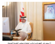
ولي العهد في اجتماع مجلس التنمية السياحية.

وأكد سموه أهمية تطبيق المخطط الذي سيتم وضعها لتعريف المهنة، ووجه بتفعيل آلية العمل التي تم الاتفاق عليها مع فريق البحرين لتعافي السريع من آثار كورونا، وذلك في إطار خطة العمل التي أعدتها الحكومة بالتعاون مع فريق البحرين لتعافي السريع من آثار كورونا.