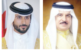
جلالة الملك محمد بن سلمان بن عبدالعزيز آل سعود ولي العهد نائب رئيس مجلس الوزراء وزير الدفاع، مع سمو الشيخ محمد بن خالد آل خليفة

أصدر حضرة صاحب الجلالة الملك حمد بن عيسى آل خليفة عاهل البلاد المفدى رئيسي الخيرية الخيرية المؤسسة الملكية للأعمال الإنسانية أمر جلالة السامي بصرف كسوة عيد الأضحى المبارك لجميع الأرامل والأيتام المسجلين لدى المؤسسة الملكية للأعمال الإنسانية. وكلف جلالة المؤسسة الملكية المؤسسة الملكية للأعمال الإنسانية برئاسة سمو الشيخ العبد الملك لأعمال الإنسانية وشؤون الشباب مستشار الأمن الوطني رئيس مجلس أمناء المؤسسة الملكية للأعمال الإنسانية، بأن تقوم جهة الأرزاء على صرف وكسوة هذه العكزة لجميع المستفيدين.